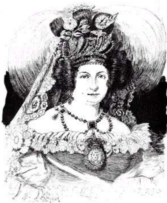
la nueva reina

Aquel día de Diciembre de 1829 el pueblo de Madrid admiró principalmente la hermosura de la nueva reina, la cual era, según la expresión que corría de boca en boca, una divinidad. Su cara incomparablemente graciosa y dulce tenía un sonreír constante que se entraba, como decían entonces, hasta el corazón de todo el pueblo, despertando las más ardientes simpatías. Bastaba verla para conocer su agudo talento, que tanto había de brillar en las lides cortesanas, y para prever las nobles conquistas que la gracia y la confianza habían de hacer prontamente en el terreno de la brutalidad y del recelo. Jamás paloma alguna entró con más valentía que aquella en el negro nidal de los búhos, y aunque no pudo hacerles amar la luz, consiguió someterles a su talante y albedrío consiguiendo de este modo que pareciesen menos malos de lo que eran. Fue mirada su belleza como un sol de piedad que venía, si bien un poco tarde, a iluminar los antros de venganza y barbarie en que vivía como un criminal aherrojado, el sentimiento nacional.