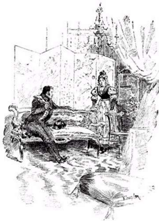
casa de Bringas

Cuando Sola se vio junto a ella tuvo que disimular su espanto, viéndose obligada a recibir el saludo de la dama y a devolverlo cortésmente. Después hablaron las dos de lo bonita que estaba la carrera, de la hermosura del tiempo, de los dichos y hechos que se contaban de la reina Cristina y del excesivo número de personas que había en casa de Bringas, las cuales rebosaban por los balcones como guindas en cesta.